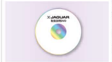
買ったその日からすぐに使える取扱説明DVD付き!