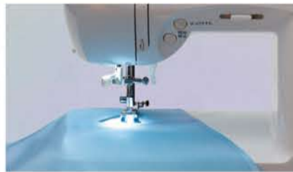
とても明るく、作業性がアップするLED採用の手もとライト。