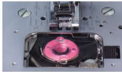
静音設計で糸がらみも少ない全回転水平釜。