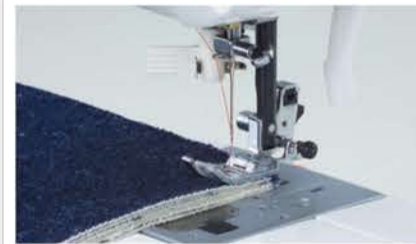
ジーンズなど、厚手の布の重ね縫いもパワフルソーイング! ※生地厚みにより、縫える枚数が異なります。