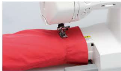
アクセサリボックスを外すと、筒縫いなどに便利なフリーアームに。