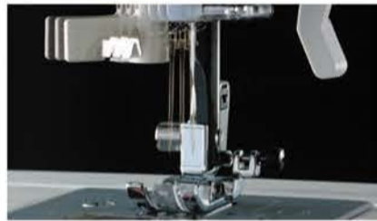
直線縫いは縫い位置を13ヵ所から自由に選択可能。